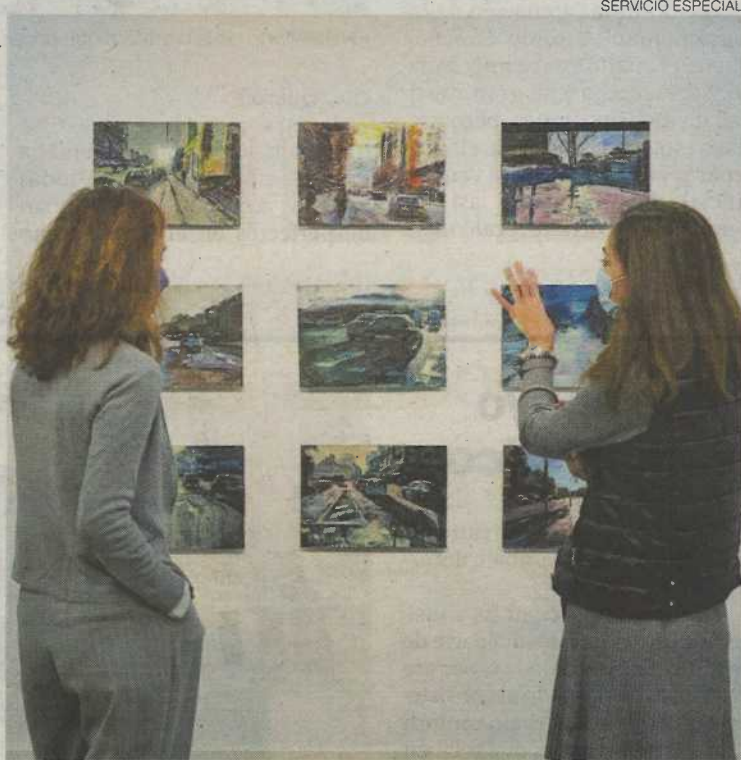
► Varias obras de la exposición de Eduardo Lozano.

En esta ocasión el pintor aragonés invita al visitante a hacer un recorrido por el ambiente de sus paisajes urbanos y naturalezas. En sus trabajos se puede apreciar la pintura con mayúsculas: luz, color, texturas, contraste y, sobre todo, emoción. A Eduardo Lozano lo que le interesa captar en sus obras es el ambiente, aunque eso suponga paisajes difuminados. Sin embargo, no realiza la obra in situ, sino que recorre los bosques, los acantilados, explora la luz y el paisaje, y, con gran sensibilidad y una mirada personal, capta con su cámara de fotos los mo-