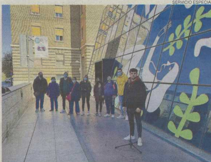
►► Un momento del rodaje del videoclip de Plena inclusión Aragón.

Por la mañana y por la tarde habrá dos charlas impartidas por